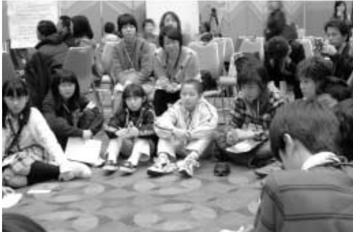
Photograph by MATSUO, Hidemasa(14)

第3回世界水フォーラム5日目、今日から「世界子ども水フォーラム」が大津プリンスホテルで開催された。午後から始まった分科会では、「家庭における水の確保」