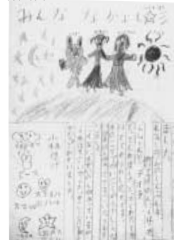
KOBAYASHI, Kayo (9)

Impressions of the World Water Forum through small encounters.