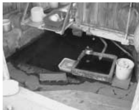
Photograph by SHIMIZU, Hirofumi(14)

Through interviewing John Matewera I found that water is gotten in very different ways in Japan and Malawi. I also thought we must preserve such traditional sights as the ones I saw in Shin-asahi-cho despite changes brought about by modernization. To do so, I think we must take more interest in water to solve various issues such as environmental problems.