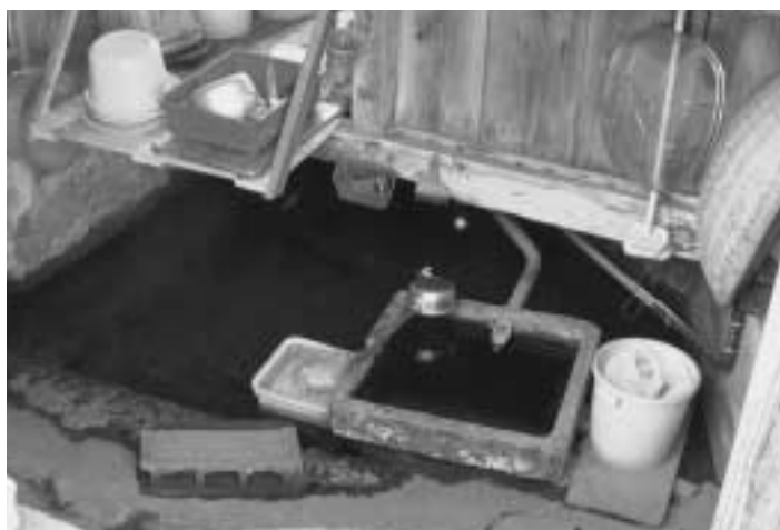
Photograph by SHIMIZU, Hirofumi(14)