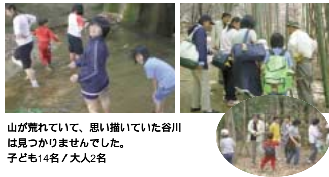
山が荒れていて、思い描いていた谷川は見つかりませんでした。子ども14名/大人2名