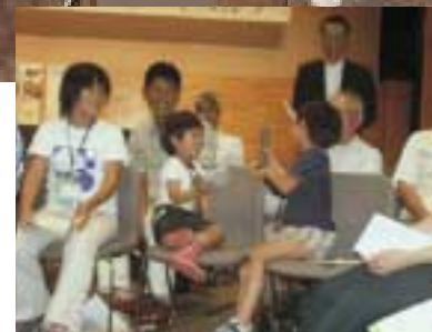
子どもも大人に負けずに発言